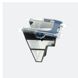
Bac filtrant (3L) débris fins 100 microns