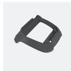
Socle pour boîtier de commande