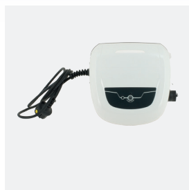
Boîtier de commande